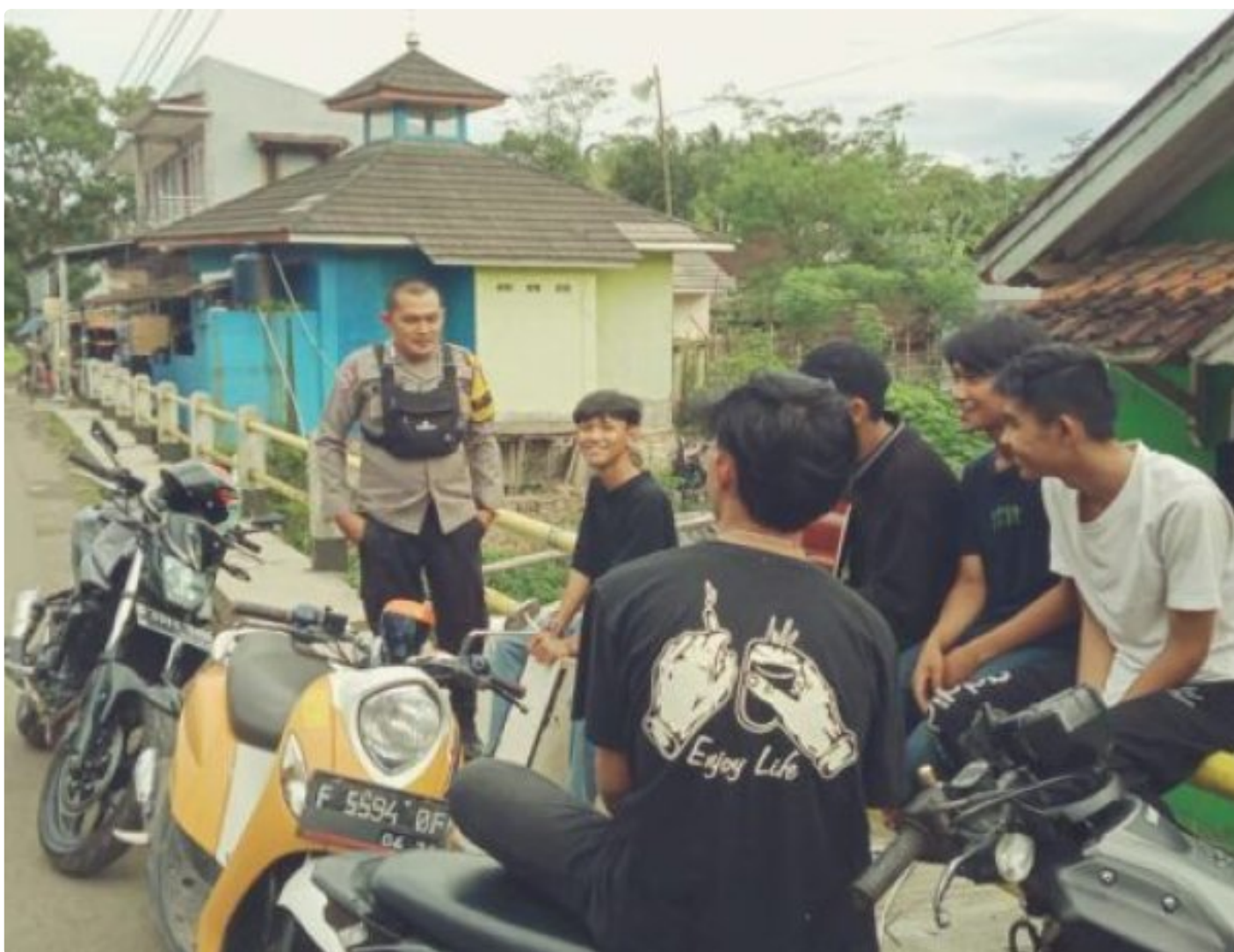
Polsek Cireunghas Polres Sukabumi Kota

Kota Sukabumi – Polres Sukabumi Kota Polda Jawa Barat – Polsek Cireunghas melaksanakan kegiatan dialogis dengan para pengemudi angkutan umum di jalan sempur, Selasa (30/1/24). Kegiatan ini bertujuan untuk menyampaikan himbauan